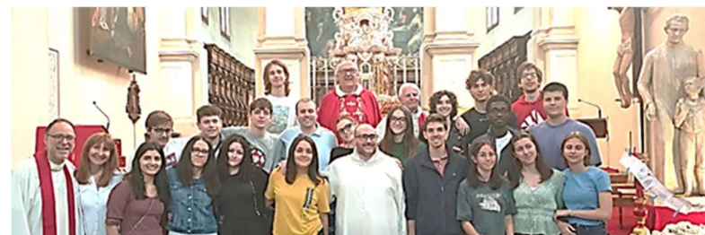
Oderzo, Padova, Montecchio e Thiene.

Nelle foto il logo della maglietta della FDM e alcuni pellegrini delle comunità di Conegliano,